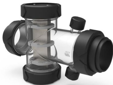
CÉLULA EN X

SMART POWER: Tecnología exclusiva: producción de cloro constante, inversión de polaridad progresiva y tecnología con memoria