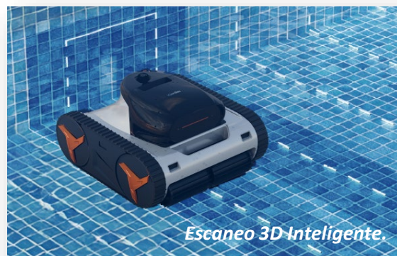
Escaneo 3D Inteligente.