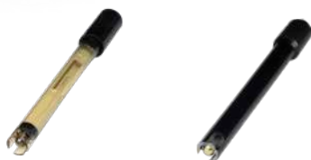
SONDA AMBER Sonda ORP

INCLUIDO: Función Bluetooth, permite visualizar y cambiar valores con el móvil + App EPOOL gratuita, con la que puede actualizar el software.